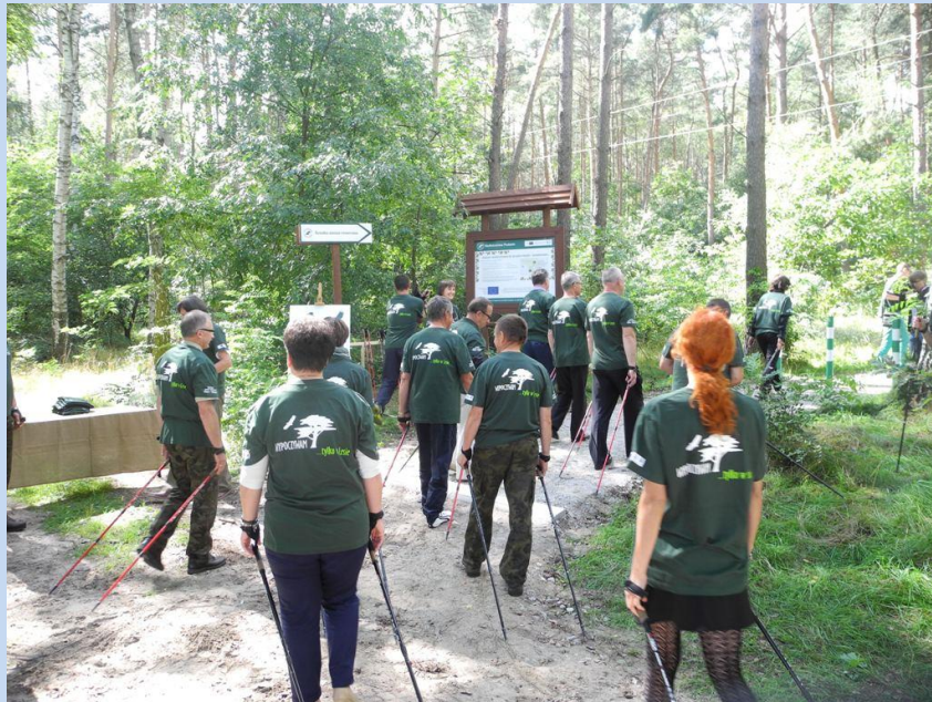
Otwarcie „ścieżki pieszo – rowerowej Studźce - Margonin”