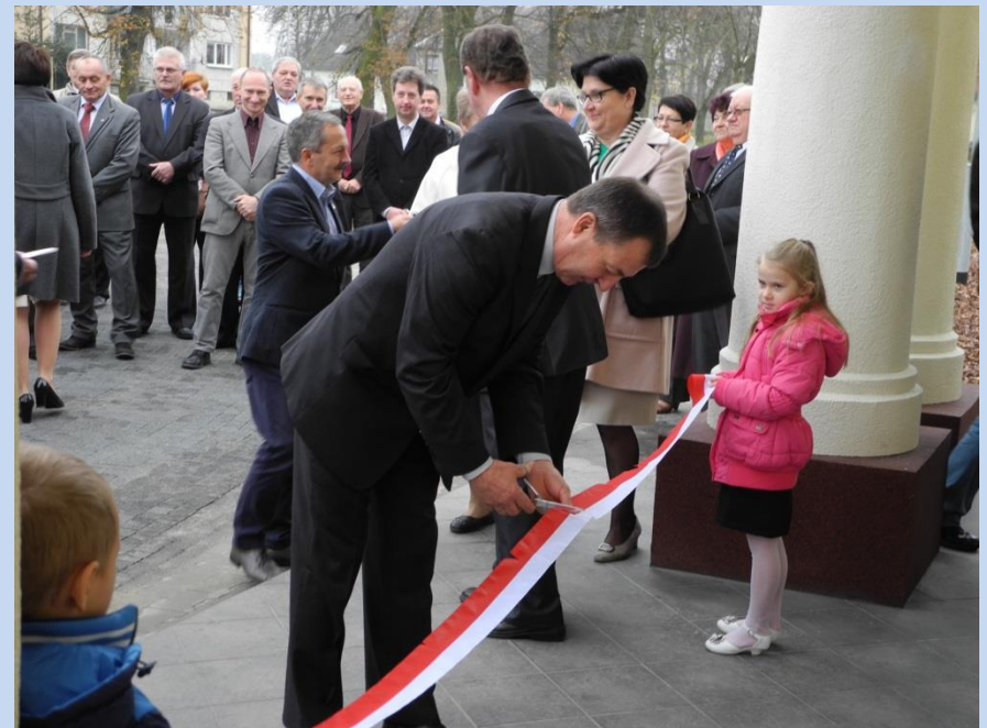
Otwarcie Świątlicy Wiejskiej w Grylewie