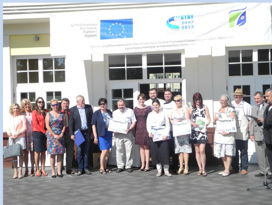
Konkurs Kulinaryny Smaki 7 Ryb