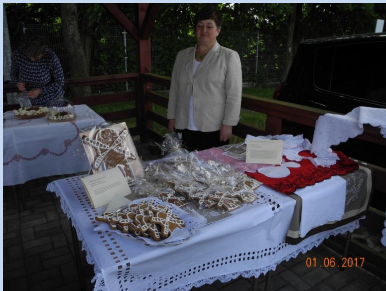
Konkurs Produkt Lokalny 7 Ryb