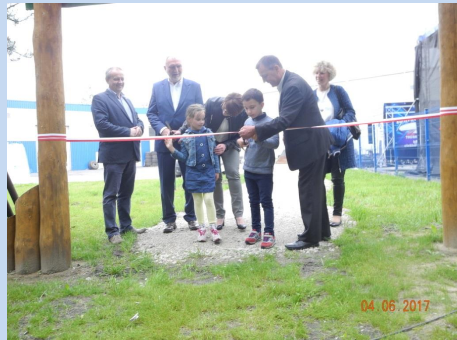
Uroczyste otwarcie ścieżki dydaktycznej „Segreguję, bo wiem”