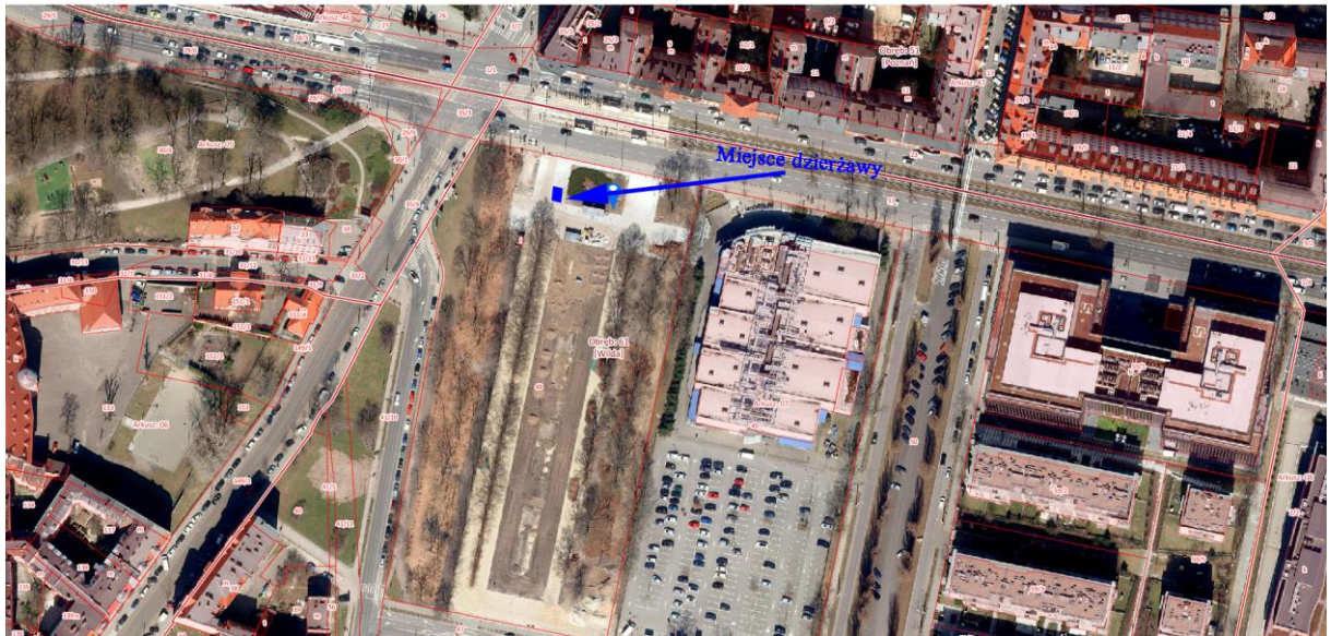
Lokalizacja nr 7