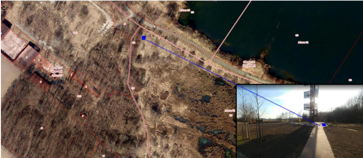
Lokalizacja nr 5