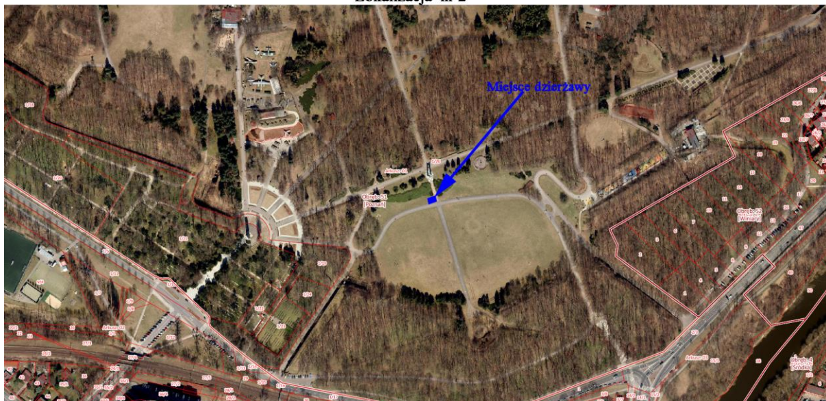
Lokalizacja nr 2

Oznaczenie geodezyjne nieruchomości: obręb Poznań, ark. 01, dz. 1/26