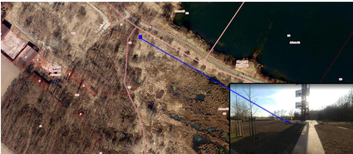
Lokalizacja nr 6