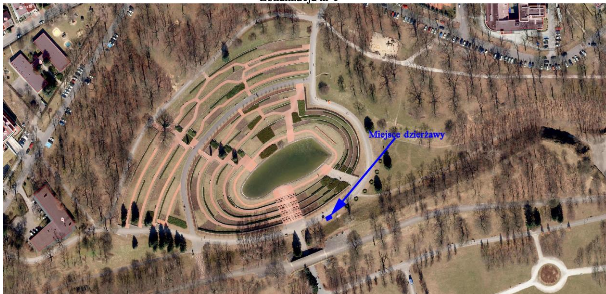
Lokalizacja nr 1

Oznaczenie geodezyjne nieruchomości: obręb Poznań, ark. 01, dz. 1/26